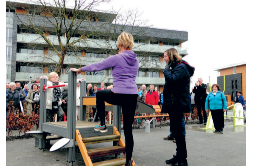
Bewegen in de Beweegtuin

Bakker & De Vos, Centrum voor bewegen en gezondheid, is een HKZ/Plus gecertificeerde fysiotherapiepraktijk, die zeer actief is in het stimuleren van bewegen.