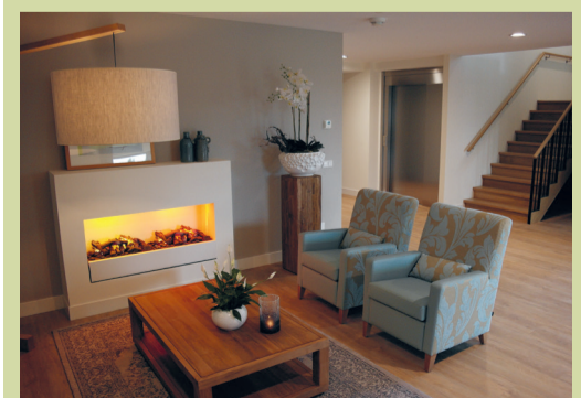
Een impressie van het nieuwe Futurahuis in Nieuwveen